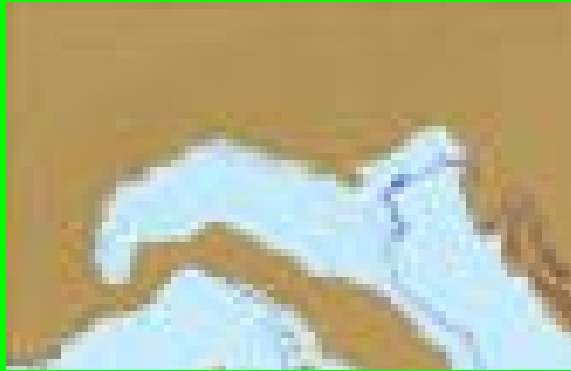
MILIONI DI ANNI FA